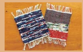
裂き織りコースター

臨海3Rステーションでは、平成29年2月14日(火)に裂き織りでタペストリー作りを行います。詳細は、4ページをご覧ください。また、卓上織り機を使ってコースターを作る無料体験は、2階体験コーナーで随時受付しています。体験時間は10時~15時、受付時間は14時30分までです。