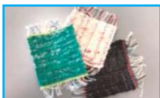
さき織りでコースター