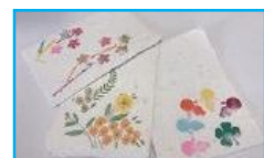
紙すきでハガキ作り