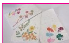
紙すきでハガキ作り