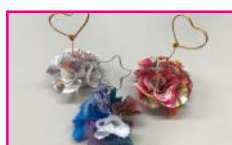
メモスタンド作り