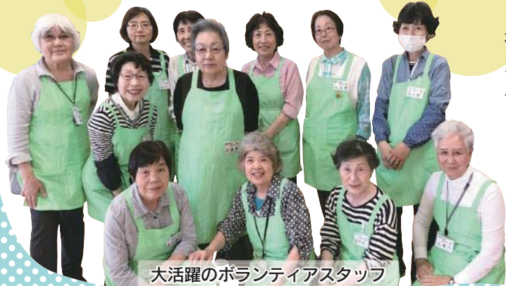
大活躍のボランティアスタッフ