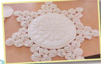
パッチワーク講座で作るヨーヨーキルトのドイリー

もっと本格的に作ってみたい方は、3R実践・ものづくりに取り組める講座に参加しませんか。「傘布で作るエコバッグ講座」「パッチワーク講座」「リフォーム講座」「古布でぞうり作り」など（一部の講座は有料）。今後の予定など、詳細は館内チラシやホームページをご覧ください。一部は市政だよりも掲載されています。