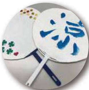
オリジナルうちわ作り