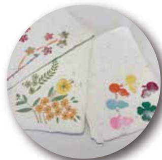
紙すきでハガキ作り