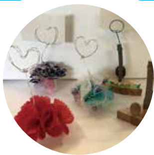
メモスタンド作り