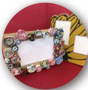
マイ写真立て作り