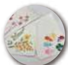
紙すきでハガキ作り