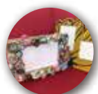
マイ写真立て作り