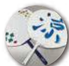
オリジナルうちわ作り